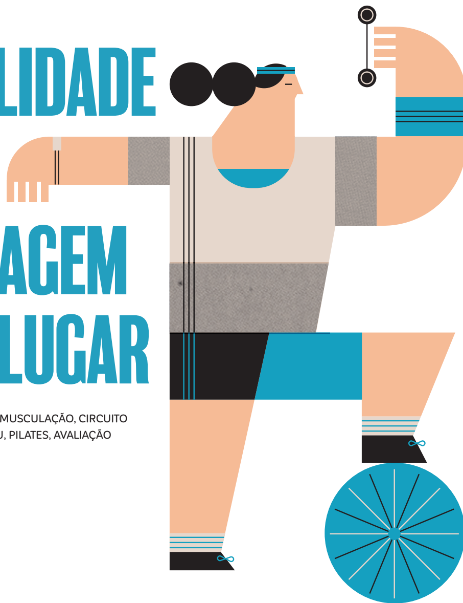
ILUSTRAÇÃO / ROMUALDO FAURA

A lunos, colaboradores e o público em geral contam desde dia 16 de abril com novo equipamento de saúde. Trata-se da nova academia da Universidade de Fortaleza (Unifor), que coloca à disposição de seus usuários equipamentos de última geração, distribuídos em área espaçosa e climatizada, com capacidade de atendimento de 1.000 usuários/dia. Entre as modalidades ofertadas para alunos, funcionários, atletas, público externo e conveniados estão: musculação, circuito funcional, spinning, muay thai, jiu-jitsu, pilates, avaliação nutricional e avaliação física. A academia funcionará de segunda-feira a sexta-feira, das 5h30 às 22h30, e aos sábados, das 8h às 12h.