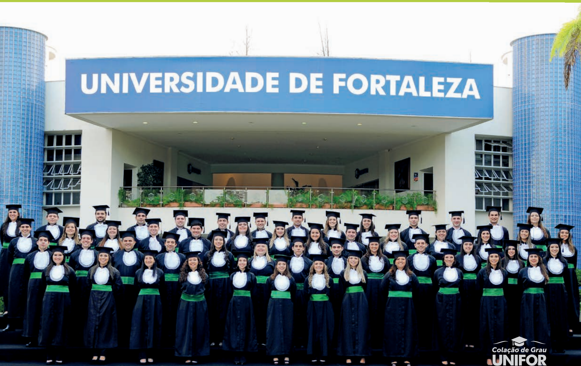
Turma de Medicina