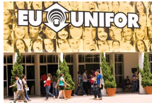
Reitora da Unifor recebe prêmio em São Paulo

renda ou com algum tipo de deficiência física que estejam excluídas do mercado de trabalho. Desde sua criação, o Centro já capacitou cerca de 6 mil pessoas. O projeto inicialmente atendia somente a Comunidade do Dendê, na região próxima ao campus, mas, devido ao seu crescimento, hoje atende comunidades carentes de toda a cidade.