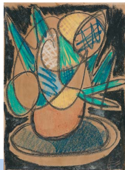
De cima para baixo: Interior, 1946; Natureza morta com flores, 1942; Vaso com flores, 1948

O abstracionismo informal observado na expressão artística de Antonio Bandeira é uma das linhas de criação do abstracionismo, movimento das artes plásticas que surgiu no início do século 20, na Alemanha, rompendo com a tradição das escolas renascentistas e abandonando a representação da realidade. O abstracionismo informal não se importava com figuras ou temas, mas exaltava as cores e formas, predominando também sentimento e emoções.