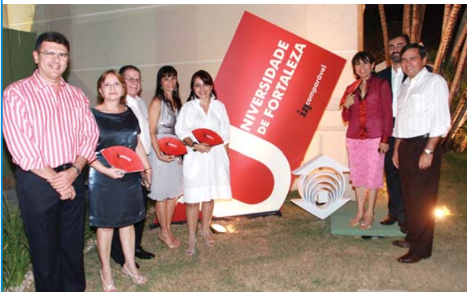
Dirigentes da Unifor na abertura da Casa Cor 2008