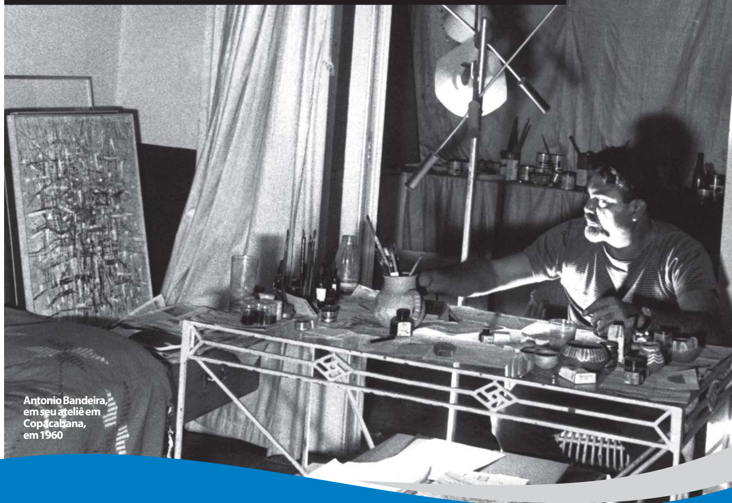
Antonio Bandeira, em seu ateliê em Copacabana, em 1960

Você sabe quem foi Antonio Bandeira? A partir de 28 de outubro, o melhor desse cearense cuja arte se destacou nos grandes centros culturais da Europa poderá ser apreciado na Universidade de Fortaleza. A mostra é gratuita e traz um panorama de suas pinturas (na maior parte, inéditas) e objetos pessoais. Nesta edição, descubra um pouco mais sobre Antonio Bandeira e sobre a exposição que traz o melhor do artista.