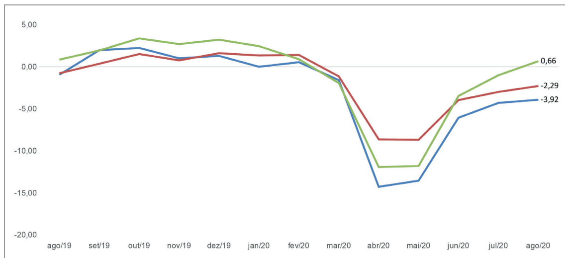
Gráfico 2 – Crescimento mensal (%) do Índice de Atividade Econômica do Banco Central (IBC) – mês contra mesmo mês do ano anterior – Brasil, Nordeste e Ceará – ago/19 a ago/20.

Fonte: Banco Central do Brasil (BCB). Elaboração: NUPE/UNIFOR.