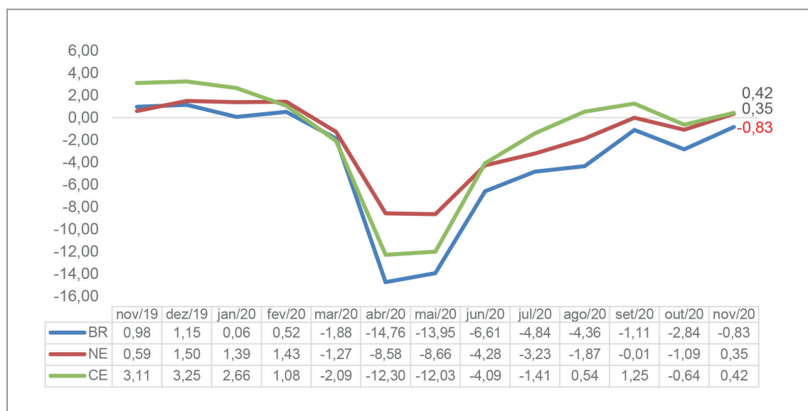
Gráfico 2 – Crescimento mensal (%) do Índice de Atividade Econômica do Banco Central (IBC) – mês contra mesmo mês do ano anterior – Brasil, Nordeste e Ceará – nov/19 a nov/20.