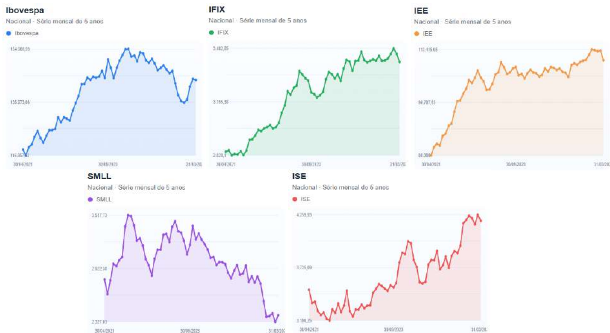
Figura 2 - Desempenho mensal dos principais índices e ativos brasileiros