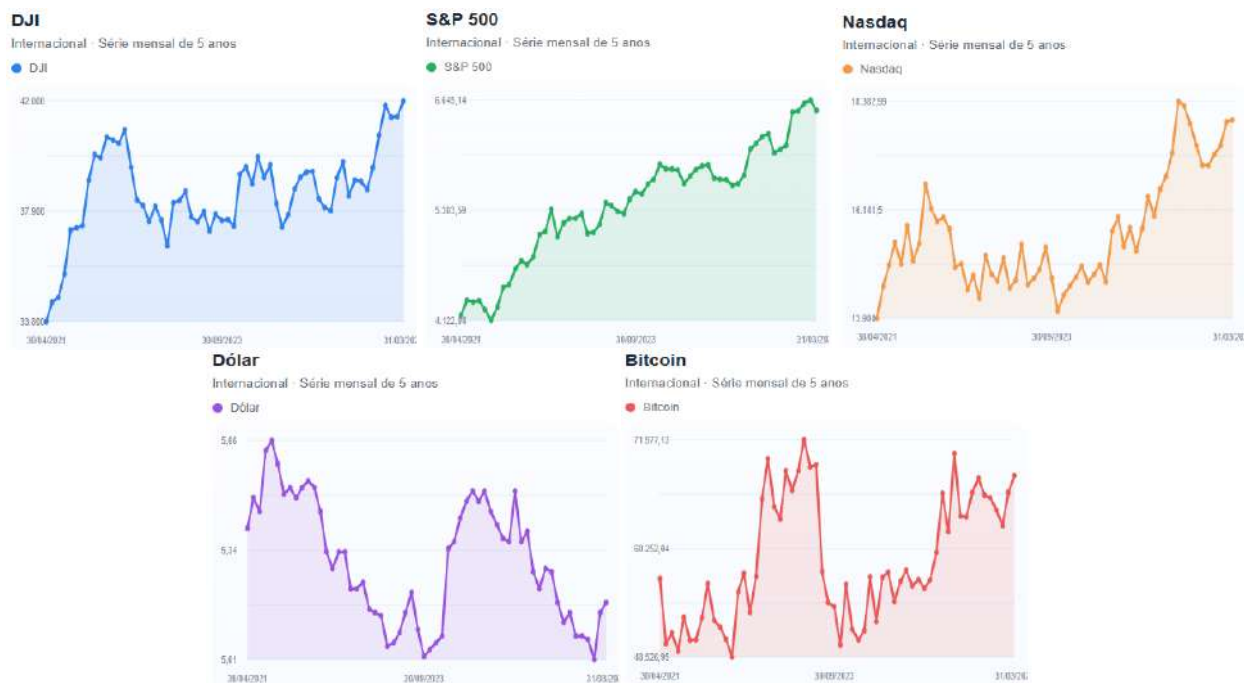
Figura 1 - Desempenho mensal dos principais índices e ativos pelo mundo

A tabela mostra que março foi um mês difícil para os mercados globais, com queda dos principais índices acionários, especialmente nos Estados Unidos. Esse movimento reflete o aumento das incertezas internacionais e da aversão ao risco. Apesar disso, quando se observa o desempenho em 12 meses, grande parte dos ativos ainda apresenta resultados positivos, indicando que a correção ocorreu após um período de forte valorização.