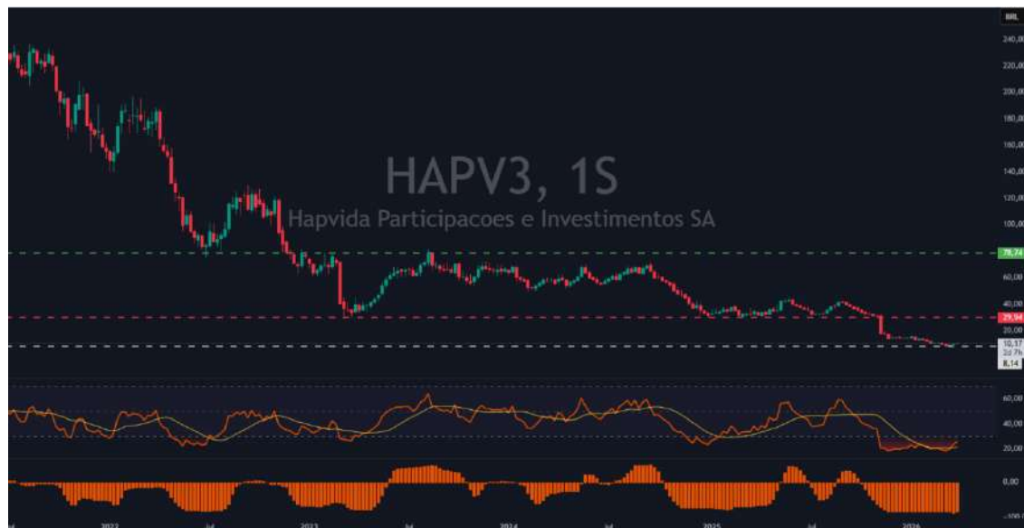
Figura 3 - Gráfico semanal Hapvida (HAPV3)